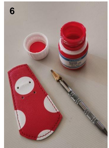
6. Réalisez, si vous le souhaitez, une finition de tranche.