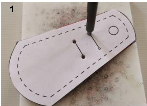
1. Prenez la pièce de patron du devant et percez les trous en vous aidant des repères.