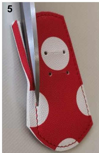
5. Réduisez la marge de couture à 3 mm.