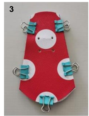
3. Posez le devant et le dos envers contre envers et épinglez.