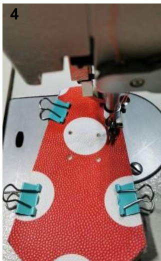
4. Cousez les deux pièces ensemble avec une marge de couture de 6 mm.