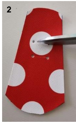
2. Découpez les lignes entre les trous.